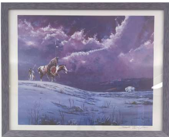
“Encounter” by Daniel Long Soldier

L'œuvre elle-même a été peinte en France dans un château à Briare, où j'ai effectué une résidence il y a quelques années. Le thème est le mouvement et, dans l'angle de l'œuvre, une petite fille souffle des bulles qui se transforment en toutes sortes de choses. La peinture murale que nous avons commencée cette année sur la clôture de la cour de récréation de l'Upper school était basée sur cette idée de souffler des bulles et d'imaginer ensuite leurs transformations.