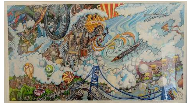
"Moving City" by Paul Santoleri

The piece itself was painted in France at a Chateau in Briare, where I had a residency a few years ago. The theme is movement and in the corner of the piece is a little girl blowing bubbles, the bubbles turn into all different things. The mural we started this year on the playground fence on the Upper School campus was based on the idea of blowing bubbles and imagining transformation.